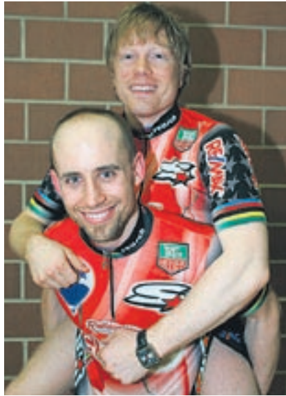
Herausforderer Reichen/Jiricek.

Alle Medaillengewinner der Radball-WM, Schweizer Meister Mosnang und der RV Winterthur treten am Samstag in Seen an.